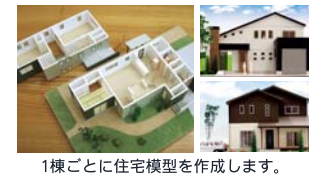
1棟ごとに住宅模型を作成します。

住まいづくりに大切なもの 住まいは間取り・空間構成・構造・設備・予算の組み合わせで決まります。でも、それは本当にあなたが求める理想の住まいですか？ 私どもがお薦めする「家づくりの羅針盤」は32個の質問からご家族が求める潜在的な理想の暮らし方を見つけていただくものです。本当に求める暮らし方、見つけませんか？